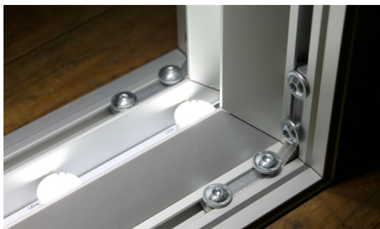
Barrettes de DEL

DURABLE : Système d'éclairage écologique, faible consommation énergétique (60W pour un caisson 39" x 78" / 1 x 2m).